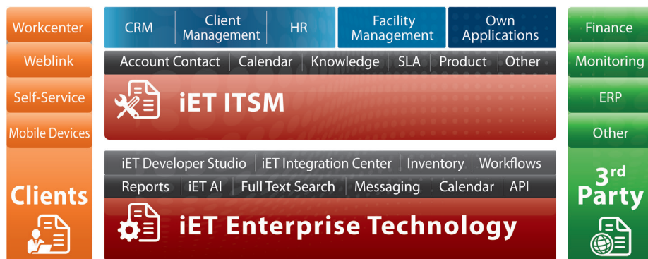
Service Management Lösungen von iET Solutions & Partnern

Partner und Kunden von iET Solutions setzen die Plattform iET Enterprise Technology zur Entwicklung eigener Anwendungen ein. Dabei bedienen sie sich der Client- und Server-Technologie von iET Enterprise Technology sowie der Prozesse und Module von iET ITSM. Die Integration von 3rd-Party-Software ist über das iET Integration Center out-of-the-box möglich. Mit dieser Lösung lassen sich Daten z. B. aus Personalsystemen, der Materialwirtschaft oder dem Einkauf in iET Enterprise Technology integrieren.