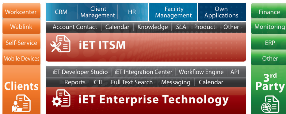
Service Management Lösungen von iET Solutions & Partnern

Partner und Kunden von iET Solutions setzen die Plattform iET Enterprise Technology zur Entwicklung eigener Anwendungen ein. Dabei bedienen sie sich der Client- und Server-Technologie von iET Enterprise Technology sowie der Prozesse und Module von iET ITSM. Die Integration von 3rd-Party-Software ist über das iET Integration Center out-of-the-box möglich. Mit dieser Lösung lassen sich Daten z. B. aus Personalsystemen, der Materialwirtschaft oder dem Einkauf in iET Enterprise Technology integrieren.